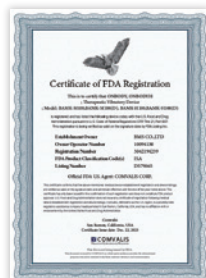
미국 FDA 등록