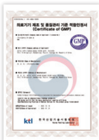
의료기기 제조 인증서