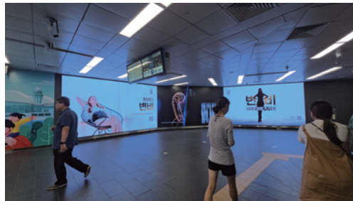
지하철 2호선 홍대입구역 옥외광고