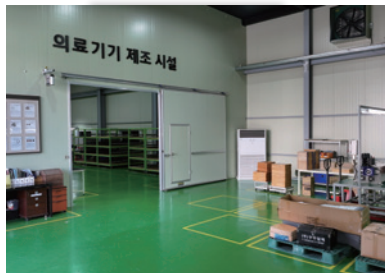
BMS 의료기기 제조 시설

식약처(KFDA) 인증 의료기기 제조, 철저한 A/S 및 품질관리, 국내 제조(Made in Korea)의 우수한 기술력 미국 FDA 1등급 의료기기 등록