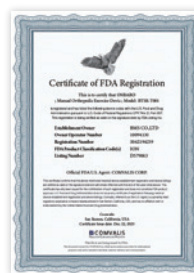
미국 FDA 등록