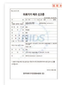
식약처 신고 제신 24-813호