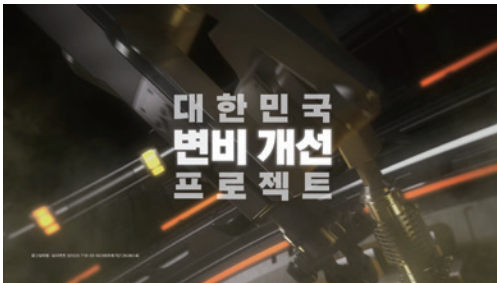
온바디 변비 개선 의료기기 CF광고