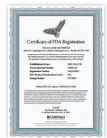
미국 FDA 등록