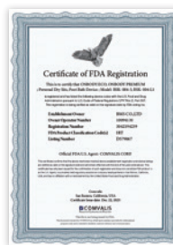
미국 FDA 등록