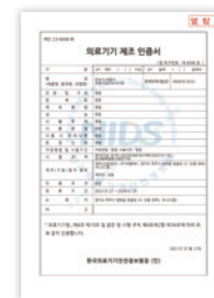
식약처 인증 제인 23-4948호