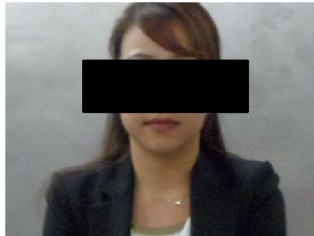
<그림 1> 피시험자 안정화