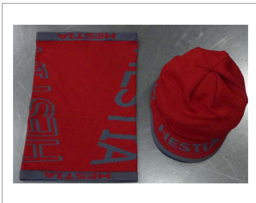
시 료 사 진