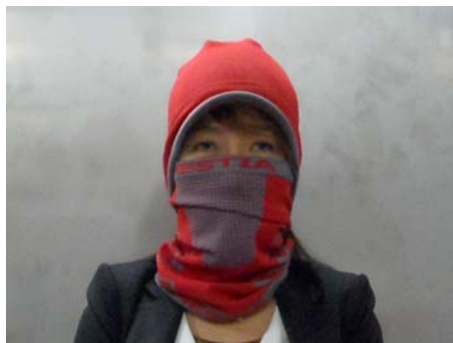
<그림 2> 피시험자 시료 착용